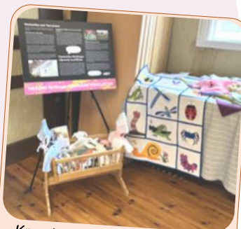
Konst- och konsthantverksutställning hos IOGT-NTO Långaryd kombinerad med fakta om narkotikans faror.