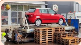
Voltbil och krocksläde lockade intresserade till MHF bland annat på trafiksäkerhetsdag i Halmstad.