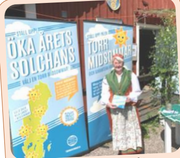
IOGT-NTO slog ett slag för torr (= nykter) midsommar när MHF Södra Västbo ordnade nyktert midsommarfirande i Vallsnäs, Unnaryd.

IOGT-NTO-rörelsen står bakom Vit jul-kampanjen.