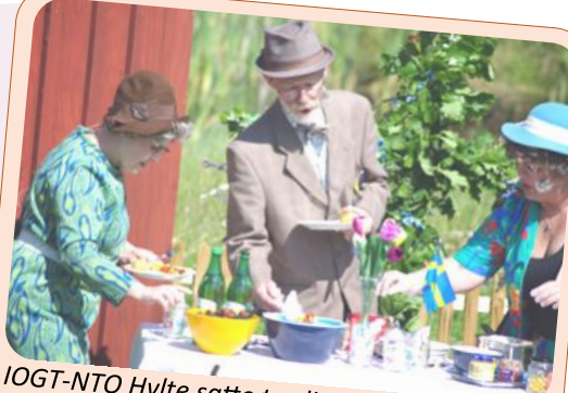
IOGT-NTO Hylte satte traditionsenligt upp en friluftsteaterföreläsning på Tiraholm under midsommarhelgen och följande helg.